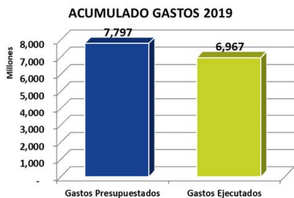
DISTRIBUCION GASTOS ACUMULADOS