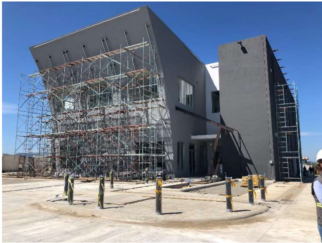
Edificio costado Este