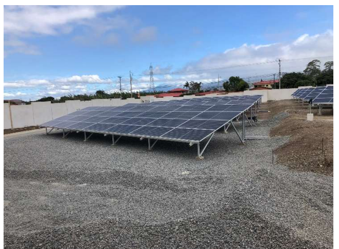
Colocación de piedrilla en terraza de paneles solares