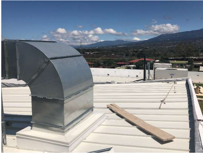
Cubierta de techo en azotea