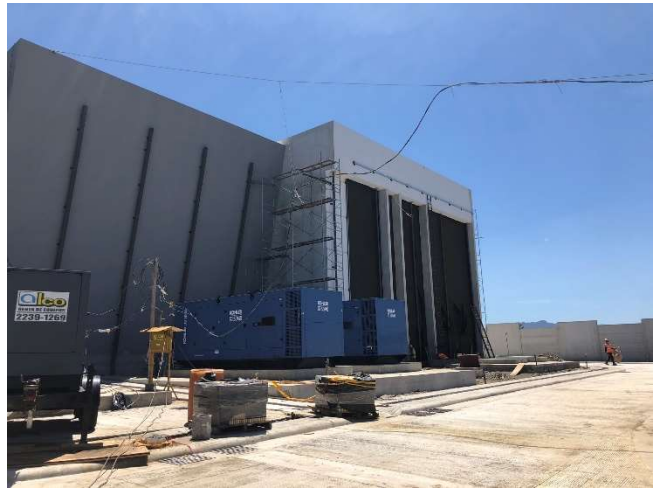
Edificio costado Oeste