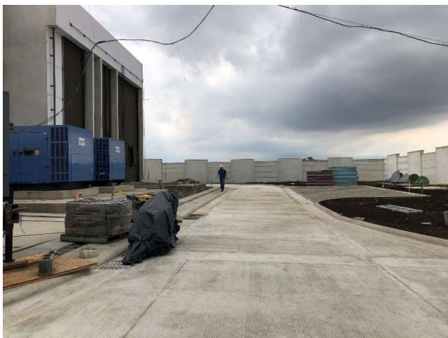
Obras complementarias en exteriores