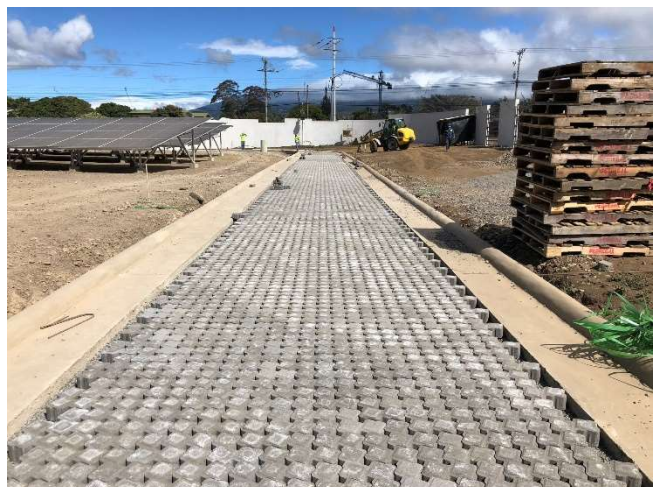
Calle adoquinada terraza paneles solares