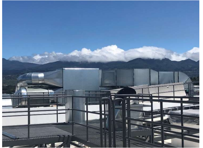
Pasarela de mantenimiento y economizadores