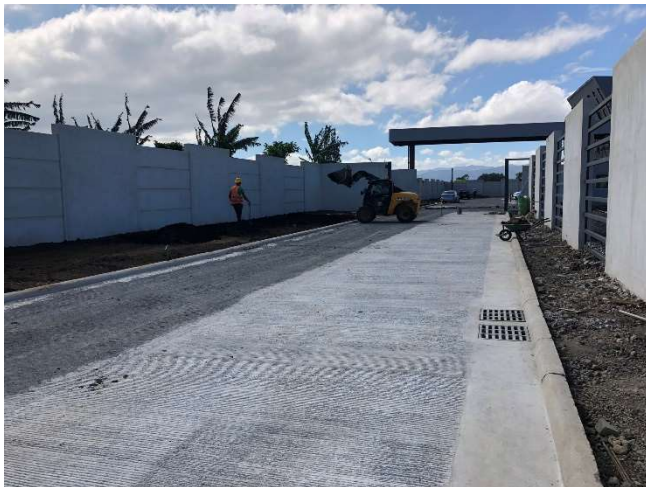
Calle principal de acceso