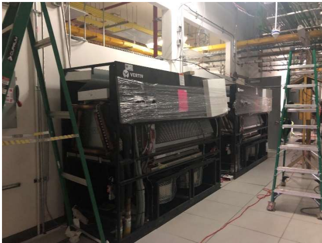
Equipos de aire acondicionado de precisión