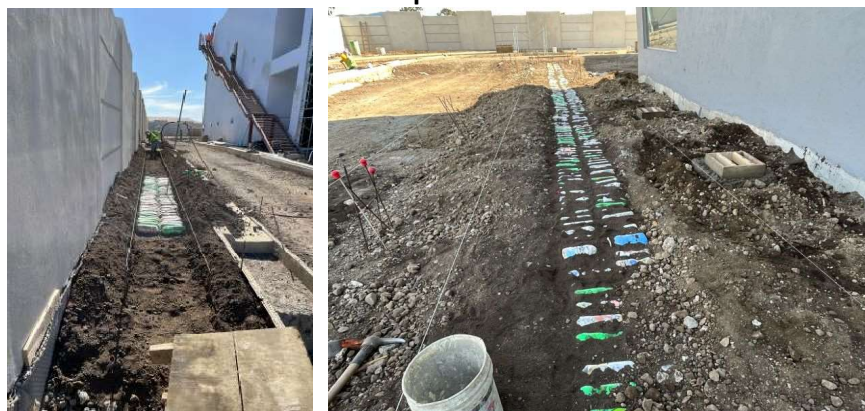
Fotografías 1.1 y 1.2 Colocación de ecobloques en rellenos de aceras

En las fotografías 1.1 y 1.2 se puede ver el proceso de colocación de los ecobloques en el área de aceras del proyecto.