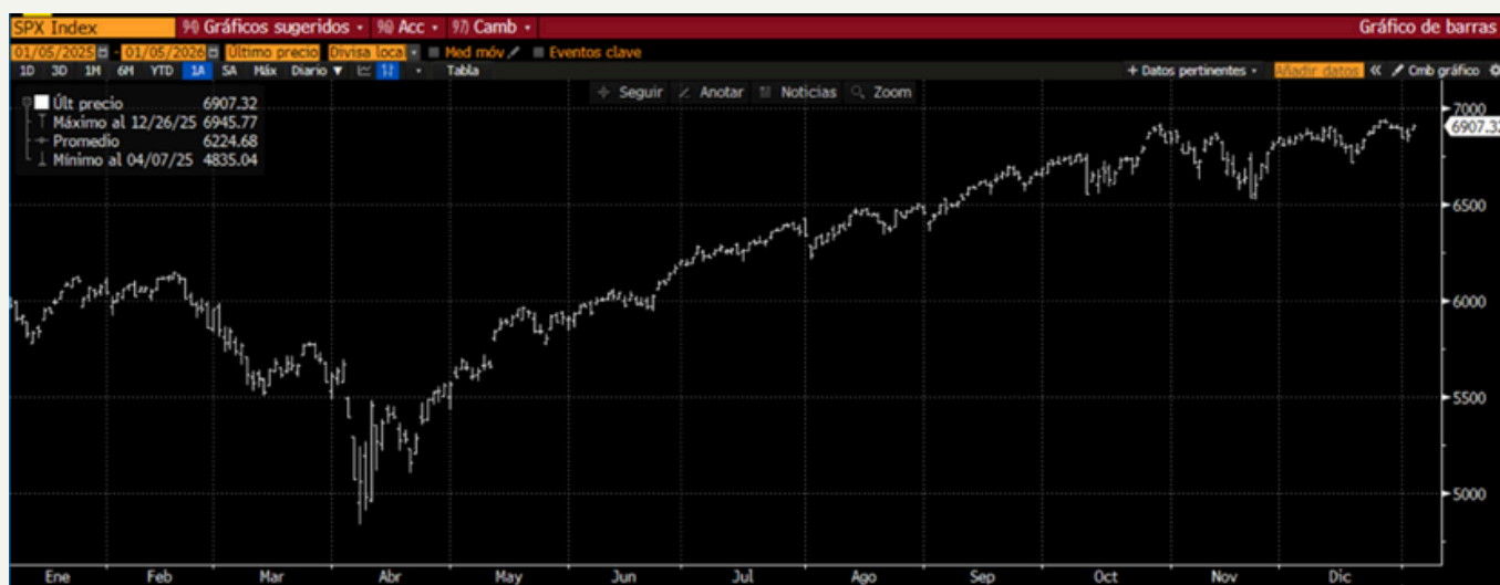
GRÁFICO S&P500 (YTD):

Las condiciones observadas durante diciembre favorecieron la generación de plusvalías , contribuyendo a un cierre positivo en los portafolios administrados por BN Vital.